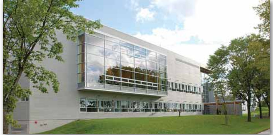
Pavillon Gene-H. Kruger, 2425, rue de la Terrasse, arrondissement de Sainte-Foy-Sillery