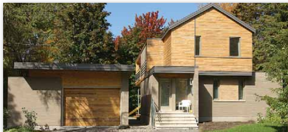
Résidence au 2090, rue Brulart Arrondissement de Sainte-Foy-Sillery