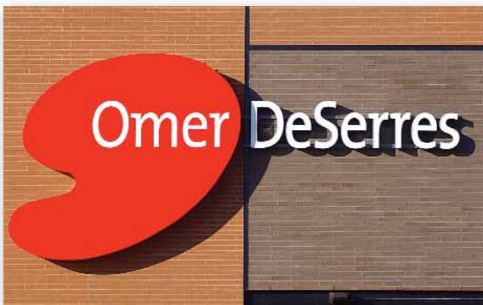
Enseigne sise au 1505, boul. Lebourgneuf Arrondissement des Rivières

Le concept d'affichage inspiré du sigle du commerce est particulièrement bien interprété et s'intègre parfaitement au mur du bâtiment qui en devient le support. L'échelle de l'enseigne, dont le message s'adresse d'abord aux automobilistes, est adéquate et véhicule efficacement son message.