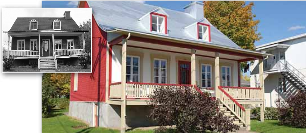
Bâtiment au 95, avenue des Cascades Arrondissement de Beauport