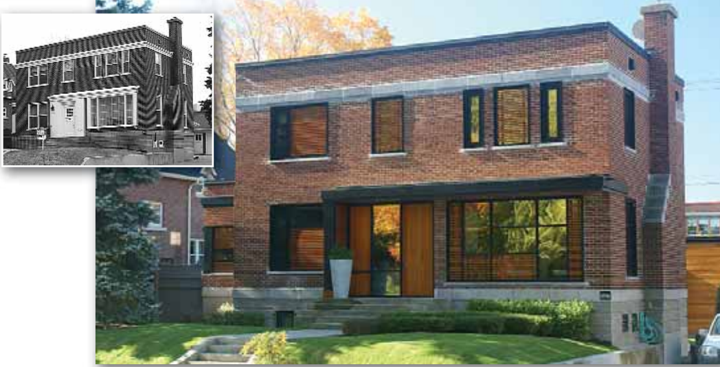
Résidence au 920, avenue des Braves Arrondissement de La Cité