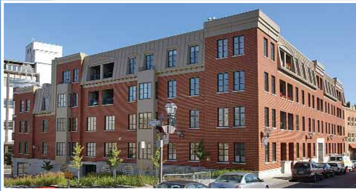
Le Saint-Paul, 273 à 289, rue Saint-Paul et 1154 à 1166, rue De Saint-Vallier Arrondissement de La Cité