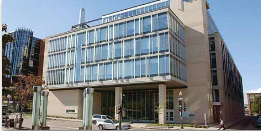
INRS, 490, rue de la Couronne, arrondissement de La Cité