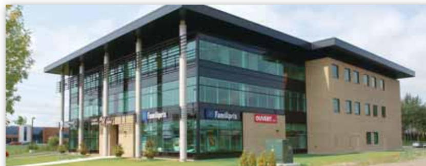
Complexe santé de la Capitale, 1300, boul. Lebourgneuf Arrondissement des Rivières

Le jury a retenu cet immeuble d'abord pour ses qualités générales de conception architecturale et de réalisation : l'équilibre des volumes et de la colonnade, l'élégant choix des matériaux, le délicat travail du métal et l'agencement des couleurs. Mais ce sont ses qualités urbaines qui ont le plus intéressé les membres du jury. Son gabarit juste, sa marge de recul appropriée et l'emplacement de son entrée principale, franchement orientée vers la voie publique qui le borde, contribuent à renforcer le caractère urbain du boul. Lebourgneuf.