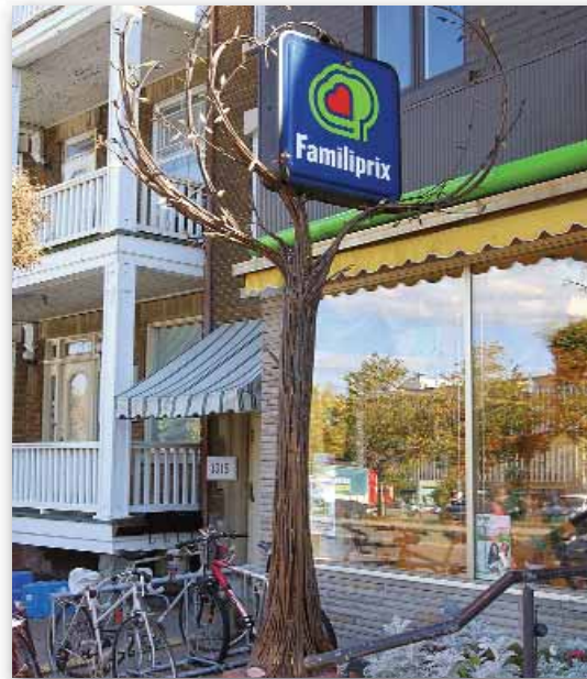
Enseigne sise au 1317, chemin Sainte-Foy Arrondissement des Rivières

Les membres du jury ont apprécié le caractère ludique de cette enseigne à l'échelle du piéton, qui a été traitée comme un élément de mobilier urbain et qui apporte une pointe d'humour dans le paysage urbain.