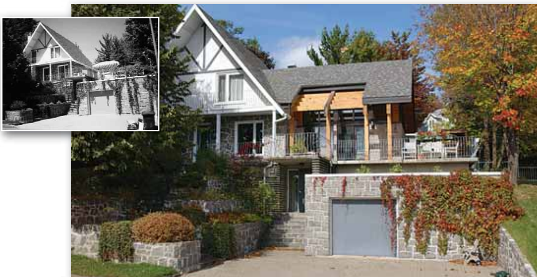
Résidence au 11740, rue De Guise Arrondissement de La Haute-Saint-Charles