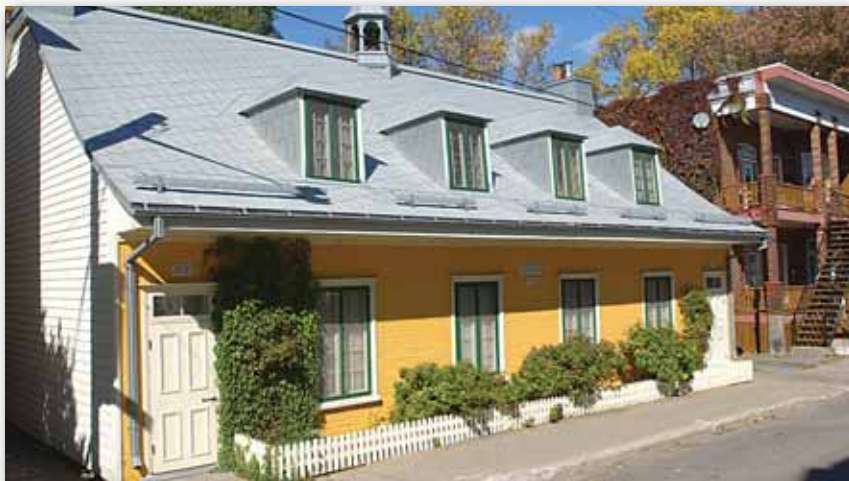
Résidence au 699-701, 3 e Rue, arrondissement de Limoilou

Toutes les réalisations dont la qualité a été soulignée lors de cet événement des Mérites d'architecture rivalisent de créativité et d'imagination. Mais elles seraient vaines si elles n'étaient pas complétées par l'effort discret et soutenu des propriétaires soucieux de préserver la qualité de leur bâtiment. Ceux-ci consacrent, année après année, temps, argent et énergie à l'entretien minutieux de leur propriété. C'est pourquoi la Ville de Québec a voulu mettre en évidence leur apport à la préservation et à la sauvegarde du patrimoine architectural.