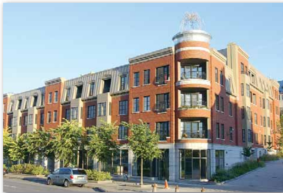
Le Saint-Paul, 273 à 289, rue Saint-Paul et 1154 à 1166, rue De Saint-Vallier Est Arrondissement de La Cité