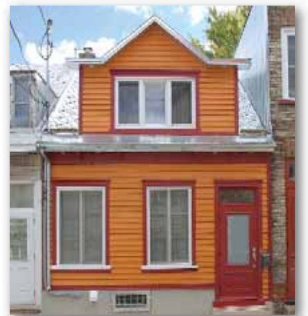
Bâtiment situé au 641, rue Lavigneur Arrondissement de La Cité

Dans un tout autre contexte, le jury tient à souligner la qualité de la rénovation de l'enveloppe du petit bâtiment du patrimoine populaire de la rue Lavigneur. La mise en valeur de cette résidence modeste à laquelle on a redonné ses lettres de noblesse et toute sa dignité est une excellente célébration du passé. Il faut souligner la qualité du travail du métal de la toiture, de même que celui de l'intégration d'une porte traditionnelle et de son imposte.